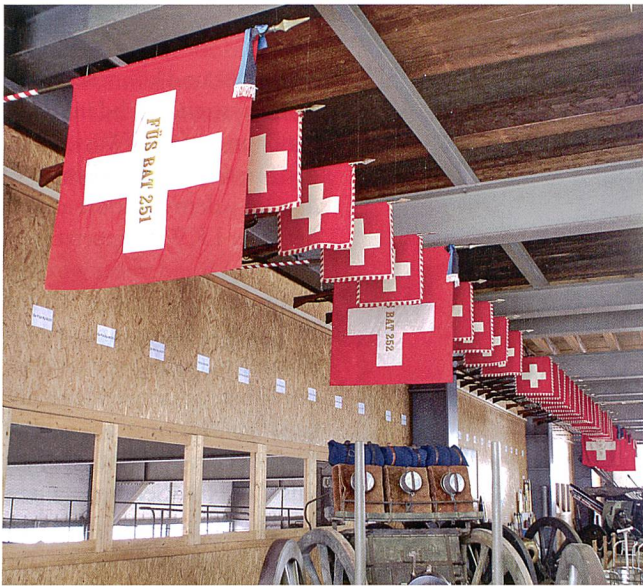
Die eindrückliche Fahngalerie im Militärmuseum.

taurierung und Öffnung von 40 weiteren einst geheimen Militäranlagen im ehemaligen Brigaderraum, unter ihnen der Brigade KP, sei «auf gutem Weg». 60 solche Zeugnisse betreut der Verein Militär- und Festungsmuseum Full-Reuenthal bereits.