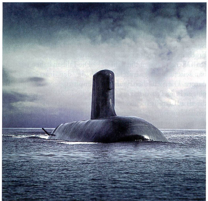
U-Boot «Shortfin Barracuda» der DCNS.

Konkret hätte die Idee eines sicherheitspolitischen Vierecks zwischen den Vereinigten Staaten, Australien, Indien und Japan bei einem Zuschlag Aufwind erhalten. Wegen dieser verteidigungspolitischen Komponente galt das japanische Angebot vielen Beobachtern lange Zeit als führend.