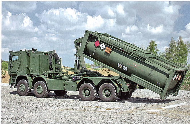
Neue Tankcontainer des Bundesheers.

Das Bundesheer beschafft in zwei Tranchen im Jahr 2016 insgesamt 20 Kraftstoffsysteme (mobile Tankcontainer) des Herstellers WEW Westerwälder Eisenwerk GmbH. Seit längerem testete die österreichische Armee einige Systeme, welche von der deutschen Bundeswehr übernommen werden konnten. Die nun bestellten Tanks sind in ISO-Rahmen