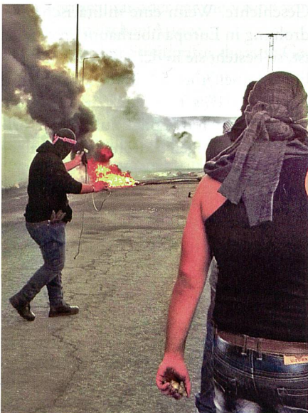
Strassenkämpfe zwischen Steine werfenden, arabischen Jugendlichen und der IDF sind zu einem alltäglichen Phänomen in Ost-Jerusalem und der West Bank geworden.

In 2015 verstärkten sich die Sicherheitsprobleme im Westjordanland und Jerusalem erheblich. Seit September kommt es beinahe täglich zu Attentaten mit Messern, Schusswaffen und Autos auf Israelis. Zwischen dem 13.09.2015 und 20.01.2016 wurden in 170 Terroranschlägen 29