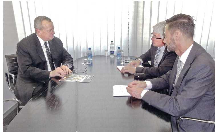
General Allen im Gespräch mit der ASMZ.

Kurz, meine frühe Berührung mit diesen Themen bildete das Fundament meiner Führungsfähigkeit in höheren Positionen.