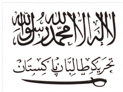
Flagge von Tehrik-i-Taliban.

ist die Sahelzone, wo Akteure des neuen Terrorismus ausländische Mitarbeiter von Hilfsorganisationen, Touristen, Firmenangestellte, Diplomaten und andere Personen entführen, um dann von westlichen Firmen und/oder Staaten Lösegelder zu erpressen. Erste international bekannt gemachte Fälle waren die Entführungen der