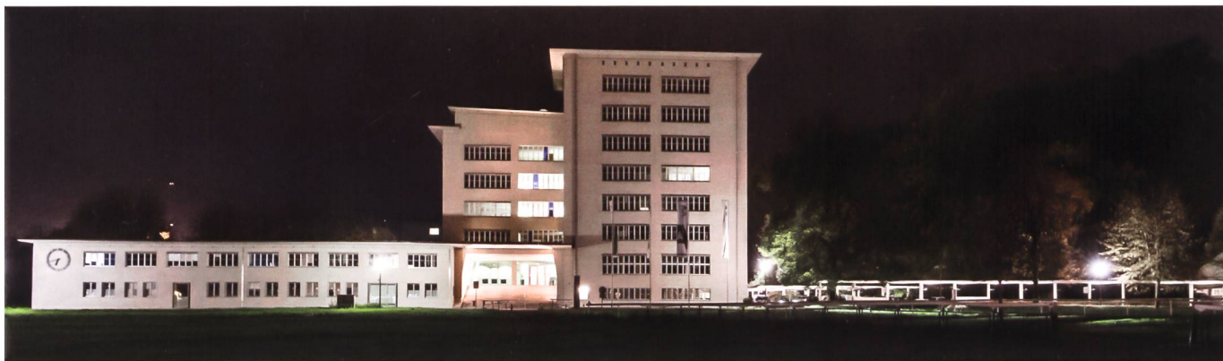
Das Kommando HKA am Armee-Ausbildungszentrum Luzern, Brennspiegel der Milizkader, am 30.10.2017.