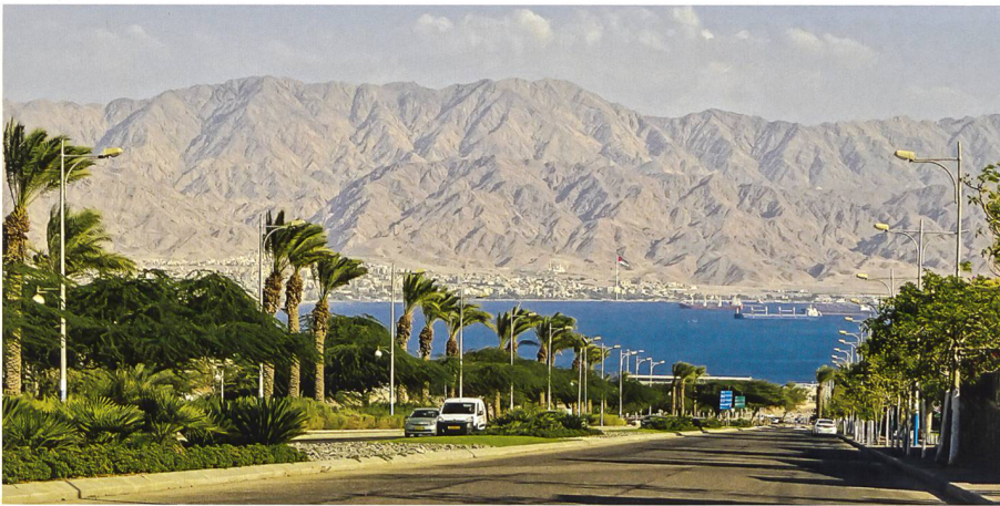
Die Bucht von Eilat mit Blick auf das jordanische Akaba. Im Februar 2017 bekannte sich der IS im Sinai zu einem Raketenangriff auf die israelische Stadt Eilat. Die Grad-Raketen wurden allerdings von Israels Iron Dome-Raketenabwehrsystem neutralisiert.

rückgekehrt und wurden daraufhin inhaftiert. Im September 2016 wurde eine gesamte Familie bei der Rückkehr nach Israel aus dem Kampfgebiet festgenommen. Das Ehepaar mit drei Kindern aus der israelischen Stadt Sakhnin war nach dem Familienurlaub in Rumänien im Juni 2015 in die Türkei und von dort nach Syrien gereist. Der Ehemann kämpfte anschließend für den IS im Irak.