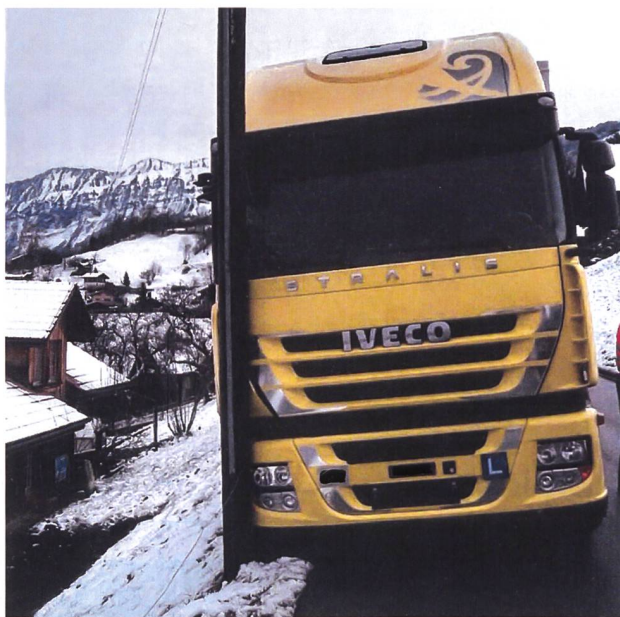
Häufigste Unfallursache: Unterschätzen der Fahrzeugdimensionen (hier während Fahrschule).

Die Schäden mit Bundesfahrzeugen verunsichern auf den ersten Blick. Studer stellte am Jahresrapport jedoch klar, dass