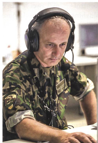
Brigadier Alexander Kohli, Kdt Inf Br 5.

schluss, einer sogenannten Konserve, trainiert: Während bisher rund 50 Prozent der zur Verfügung stehenden Zeit auf dem ELTAM für die Aktionsplanung (AP) auf Stufe Truppenkörper und Einheiten aufgewendet wurden, erlaubte es der neue Ansatz der Inf Br 5, während zwei ganzen Tagen die Prozesse in der Lageverfolgung (LV) zu vertiefen – und gleichzeitig die zeitliche Belastung der Milizkader dank späterem Einrücken zu reduzieren. Insgesamt bringt die sogenannte «ELTAM-Konserve» so fast einen Tag mehr Zeit für die Lageverfolgung und ist erst noch milizfreundlicher.