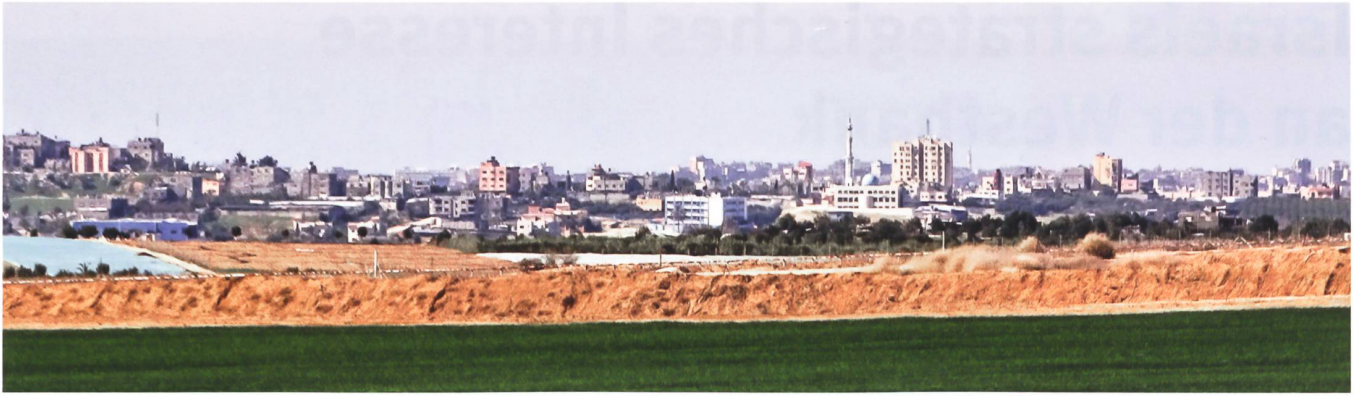
Blick in den Gazastreifen. Israel hat sich bereits 2005 aus diesem Gebiet zurückgezogen. 2007 ergriff die Hamas dort die Macht.