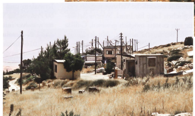
Blick auf einen israelischen «outpost» in der Westbank. Diese Siedlungen liegen zwar im C-Gebiet, aber ausserhalb der grossen Siedlungsblöcke.

Israel bis heute in einer äusserst feindlichen Umwelt. Zumal die politischen Entwicklungen im Nahen Osten volatil und nur schwer vorhersehbar sind. Daher haben die sicherheitspolitischen Bedürfnisse absolute Priorität in Israels Politik.