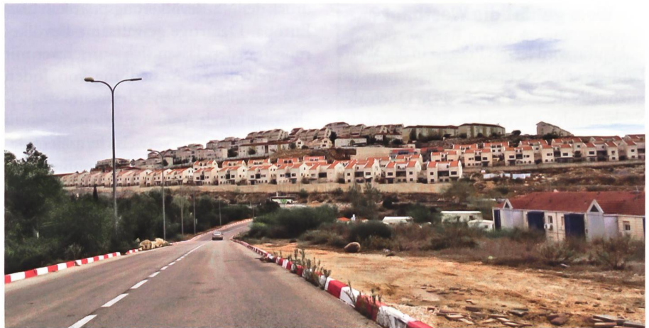
Blick auf Ariel – eine von Israels grösseren Siedlungsblöcken. Die Kleinstadt mit rund 20 000 Einwohnern ragt ca. 17 km jenseits der «Grünen Linien» in das Westjordanland hinein.

Der Gazastreifen war deutlich schwerer zu kontrollieren. Das dicht bevölkerte, schmale Gebiet war unter der ägyptischen Besatzung in Armut versunken. Es bot keine strategischen Vorteile für Israel und war ein Hort des palästinensischen Widerstands. Ariel Sharon entschied sich daher 2005 zum unilateralen Rückzug, was allerdings der Machtergreifung der Hamas den Weg ebnete.