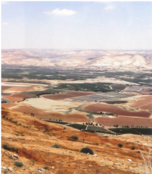
Blick über den nördlichen Jordangraben. In der Mitte schlängelt sich der Jordan entlang und bildet die jordanisch-israelische Grenze. Der Jordangraben hat eine grosse strategische Bedeutung für Israel.

Mit Blick auf die Westbank ist das Konzept der «verteidigbaren Grenzen» entscheidend. Israel kann es sich nicht leisten, eine grosse Armee ständig unter Waffen zu halten. Daher verfügen die IDF über einen kleinen Kern an Berufssoldaten. Ein wesentlicher Teil der Streitkräfte stellen Wehrdienstleistende; zum Grossteil besteht die Armee allerdings aus Reservisten, die im Ernstfall mobilisiert werden. Im Falle eines Angriffes müssen die Berufssoldaten und Wehrdienstleistenden die Angreifer solange aufhalten, bis die Reserve mobilisiert ist (24–48 Stunden). Angesichts des militärischen Übergewichts der arabischen Nachbarstaaten ist es für Israel notwendig, über einen günstigen Grenzverlauf zu verfügen, der topografische und taktische Vorteile bietet und den Streitkräften Manövrierspielraum im Inneren lässt.