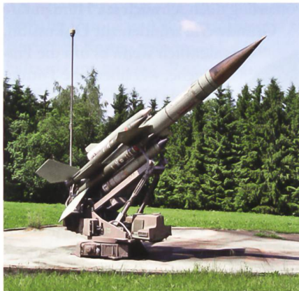
BL-64 – letzte Flaklenkwaffe grosser Reichweite der Schweizer Armee.

für müsse das VBS die notwendigen Ressourcen bereitstellen. Zudem setze ein beschleunigter Beschaffungsprozess nicht zwingend den Beizug eines Generalunternehmers voraus. Von diesem Grundsatz war die armasuisse für die Beschaffungsvorbereitung des Projekts BODLUV 2020 abgewichen und hatte entschieden, einen Generalunternehmer, welcher über Arbeitsplätze in der Schweiz verfügt, beizuziehen. Dieser sollte für solch eine Aufgabe natürlich etwas von der Materie verstehen, es musste daher ein Unternehmen gewählt werden, welches selber im Bereich Fliegerabwehr tätig ist. Damit wurde aber