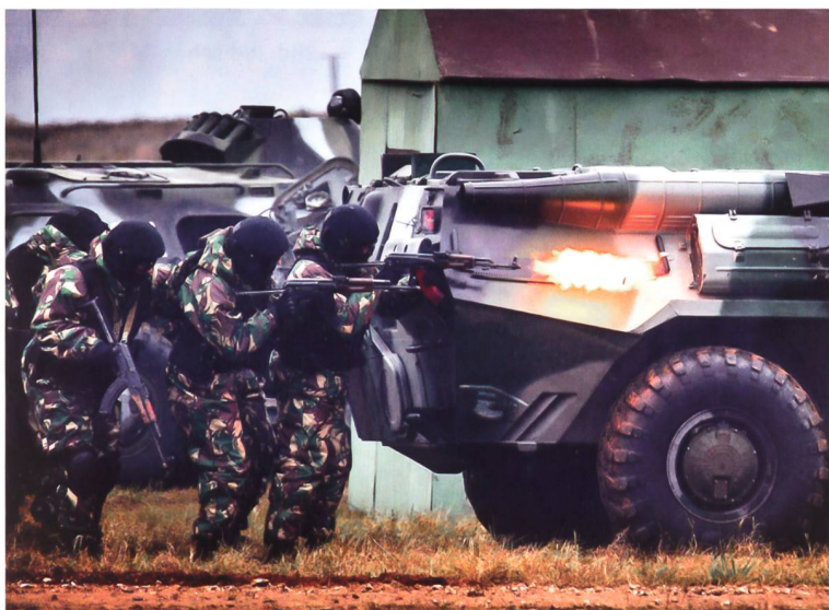
Einsatzübung der Nationalgarde.

regelt. Gleichzeitig sieht die neue Rechtslage im Falle einer Krise im Inland eine direkte Unterstellung der russischen Streitkräfte unter die Nationalgarde vor. Entsprechend kann davon ausgegangen werden, dass Russland derzeit eher mit einer Krise im Inneren als einer grösseren Bedrohung von Aussen rechnet. Bereits werden durch die Nationalgarde besondere IT-Einheiten zwecks Analyse der Social-Media eingesetzt. Dazu äussert sich der russische Premier Dimitry Rogozin eindeutig: «Die Rosgvardiya muss Russlands aggressivste Militäreinheit sein, bewaffnet bis an die Zähne mit der besten und technologisch fortschrittlichsten Ausrüstung. Denn nur so können die Hauptprobleme im Land gelöst werden.»