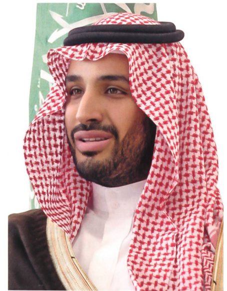
Saudi-Arabiens Verteidigungsminister Mohammed bin Salman ist das Gesicht der arabischen Militäroperation. Seine weitere politische Karriere ist eng mit dem Ausgang der Intervention verbunden.

lassen, doch nach Berichten von US-amerikanischen Offiziellen sind die iranischen Waffenlieferungen in den letzten Monaten angestiegen. Mittlerweile liefert der Iran fortschrittliche Waffensysteme, die es dem Huthis-Saleh-Block erlauben, die militärische Überlegenheit der arabischen Allianz teilweise zu neutralisieren. Bei-