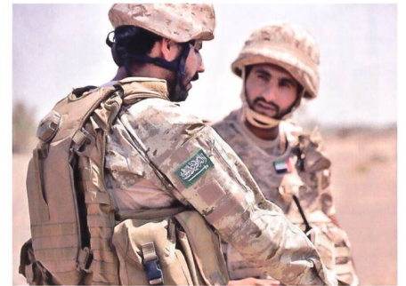
Ein saudi-arabischer Soldat und ein Soldat der VAE. Die beiden Länder sind die militärisch stärksten arabischen Staaten.

Waffen hält. Die USA betrachten das lokale Al-Qaida-Franchise als den gefährlichsten Zweig der Terrororganisation, weil die Gruppe bisher mehrfach ausserhalb des Jemens zuschlagen hat. Beispielsweise ge-