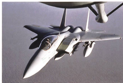
Eine F-15 der königlichen saudi-arabischen Luftwaffe. Die arabischen Streitkräfte verfügen nicht über die Fähigkeit zur Luftbetankung. Daher stellen die USA dies zur Verfügung.

Nachdem der Transformationsprozess im Jemen nach der Abdankung des Langzeitherrschers Saleh Ende 2011 geglückt war, blieb der Transformationsprozess Anfang 2014 stecken. Die schiitische Huthis-Bewegung nutzte die Frustration der Bevölkerung, um die Hauptstadt Sanaa sowie weite Teile des Landes zu erobern und schliesslich die Macht zu übernehmen. Seither tobte ein Bürgerkrieg zwischen den Huthis, die vom ehemaligen Machthaber Ali Abdullah Saleh und ihm loyalen Einheiten der jemenitischen Streitkräfte unterstützt werden, und einer Anti-Huthis/Saleh-Allianz um den international anerkannten Präsidenten des Landes, Abed Rabbo Mansour al Hadi, bestehend aus