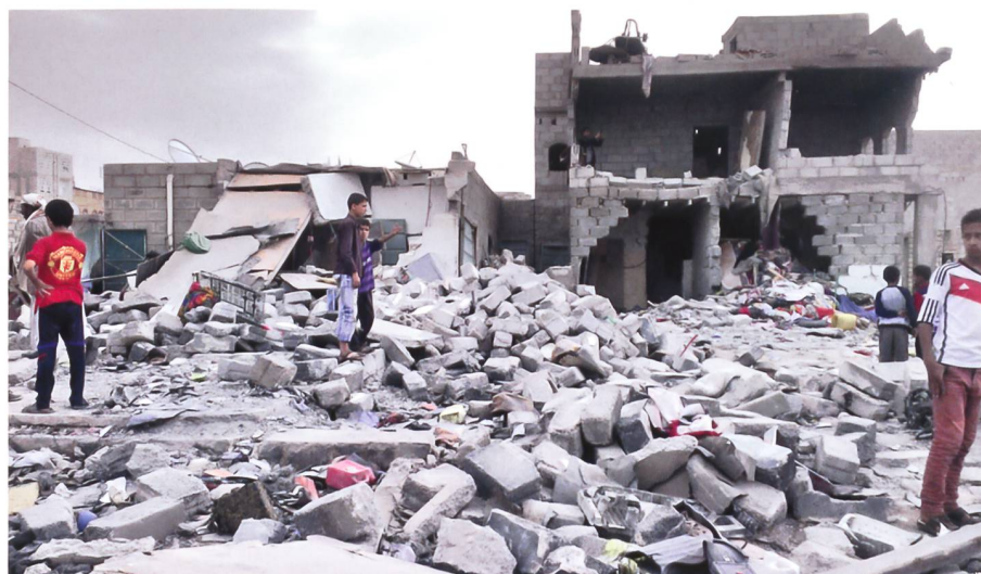
Die Luftschläge der arabischen Koalition legen Jemens Städte und Infrastruktur in Schutt und Asche. Zerstörungen nach einem Luftschlag in Sanaa im Oktober 2015.

Trotz einiger Rückschläge ist der Huthis-Saleh-Block aber noch immer militärisch schlagkräftig – die Allianz ist weit davon entfernt, geschlagen zu sein. Sanaa