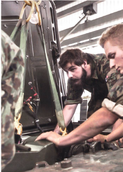
Volle Konzentration beim Einbau der Antriebsgruppe in den Panzer LEO.

erfolgreich angegangen. Dank einem guten Klima gelingt es im Pz Bat 29 nicht nur, die Kp Kdt-Positionen, sondern auch die Funktionen im Stab zu besetzen. Viele interessieren sich für die Weiterausbildung und das stimmt zuversichtlich.