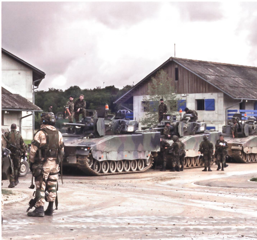
Pz Gren Kp 29/4 im GAZ West.

während den ersten Wochen der Rekrutenschule – beurteilen die Kp Kdt allerdings unterschiedlich.