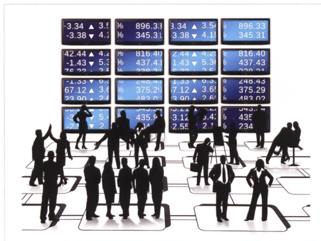
Digitalisierte Welt. Ist der Mensch noch Mittelpunkt?

Die Technologie und die AI wurden auch für das Militär wichtiger. Die Führungsstrukturen wurden angepasst, weniger Kader wird benötigt. Sowohl beim Militär als auch im zivilen Umfeld wurde die Eigenverantwortung des Einzelnen grösser. Die Verschmelzung von Kader und Leadership gehört zum Alltag (adaptive Leadership*). Sinnvermittlung ist der