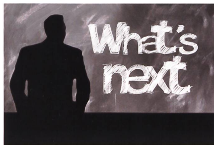
Die Schweiz von morgen wird heute von uns geprägt.

Statt zu versuchen, uns ständig mit der Wirtschaft zu vergleichen, sollten wir uns eher differenzieren. Diese Differenzierung stellt sich als Mehrwert des Kadern dar. Die Armee muss sich vermehrt auf die