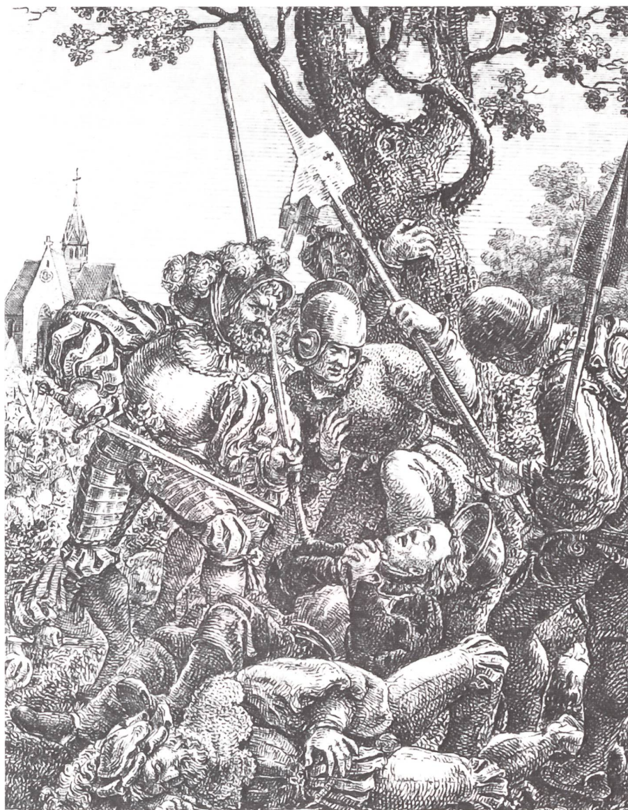
Zwinglis Tod auf dem Schlachtfeld bei Kappel a A 1532.

Bereits zwei Jahre vor Luthers Schrift hatte Ulrich Zwingli in der gleichen Sache zur Feder gegriffen. Die konfessionelle Spaltung der Eidgenossenschaft drohte zum Krieg zu eskalieren. Auch Zwingli, der früher pazifistische Gedanken vertreten hatte, musste nun Farbe bekennen. Seine Schrift «Plan zu einem Feldzug» enthält klare Aussagen zu Krieg und Soldatentum. Auch Zwingli ging es um Ethik. Im Gegensatz zum Mönch aus Wittenberg vertrat der Ammannssohn aus dem Toggenburg ein demokratisches Gesellschaftsmodell, das der Kirche ein Lehr- und Wächteramt übertrug. Nur der Staat