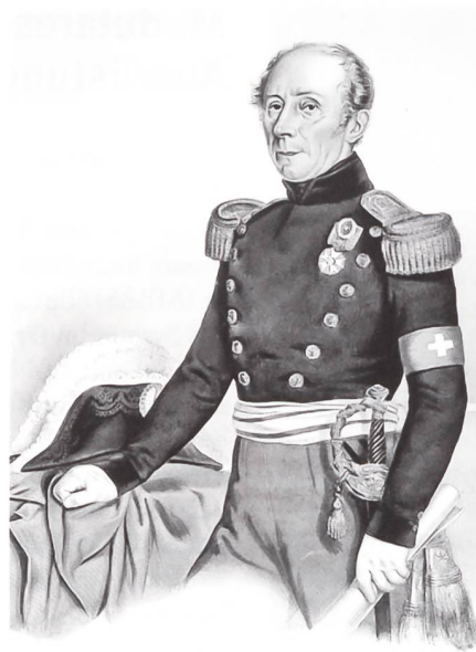
Guillaume-Henri Dufour (1787–1875)

• Zwingli entwickelte Gedanken, was ein militärischer Führer zu wissen und zu beachten habe. Nach Ausschaltung der Söldnerführer konnte er nicht mehr mit kriegereischer Erfahrung rechnen. So meinte er: «Und sehe man all weg me gotzvorcht, trüw und warheit an weder kriegens kunst. Mag man sy aber by einandren finden, bruche man denselben.» Er soll handeln «wie der gros Alexander tätt, der ein 'n alten knecht,