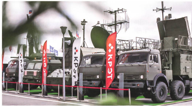
Gekauft! EW-Systeme an der ARMY-2017.