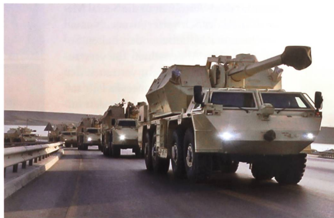
Trotz Exportverbot, tschechische DANA in Aserbaidschan.

Mit der Beendigung der russischen Herbstmanöver sah auch der tschechische Verteidigungsminister Martin Stropnický den richtigen Zeitpunkt für mehr Rüstungsgelder gekommen. Deshalb kündigte er per Ende September noch zeitgerecht vor den Wahlen im Oktober eine Budgetspritze von mehr als vier Mia. Euro für seine Streitkräfte an. Diese sollen damit bis 2026 modernisiert