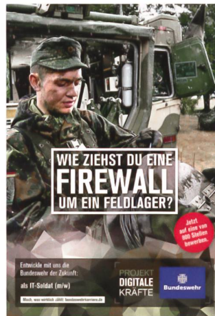
Werbung für digitale Berufe.

stockt werden. Um diesen Bestand mit besonders qualifizierten Personen erreichen und halten zu können, musste deshalb auch in die Bildungslandschaft eingegriffen werden. An der Bundeswehrhochschule in München wird ein Forschungs-