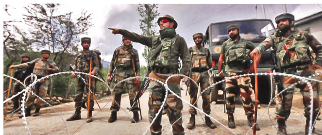
Indische Grenztruppe in Kaschmir.

Auf einem Seminar der Denkfabrik «Centre for Land Warfare Studies» in Neu-Delhi behauptete Rawat, dass China