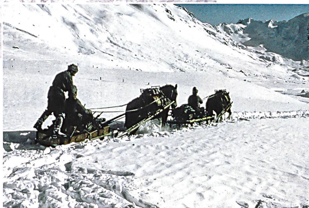
Der durch das Schauflerdetachment gebrochene und durch die Pferde gefestigte Ruttnerpfad wird anschliessend mit Schlitten trassiert.

Hat die Skipatrouille die Routenführung ausgesteckt, folgt ein Schauflerdetachment. Dieses bricht den Schnee von beiden Seiten in die Wegmitte, damit ihn die nachfolgenden, am langen Zügel geführten Spurpferde verdichten. Eine Sisyphusarbeit! Die dampfenden Pferdeleiber bahnen sich nackt, das heisst ohne Beschirung und – je nach Schneeverhältnissen, zwecks Vermeidung von Selbstverletzung – ohne Eisen an den Hufen, watend und «schwimmend» den Weg.