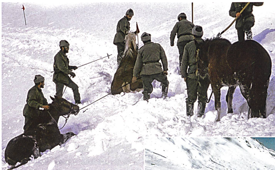
Ruttnerosse kämpfen sich mit fast schwimmenden Bewegungen durch die Schneemassen.