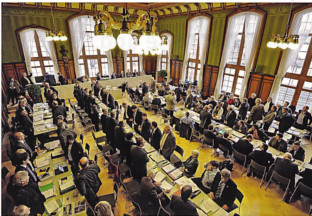
Grosser Rat Kanton Thurgau bei einer Abstimmung.

Per 1.1.2018 gibt es 2222 Gemeinden. Auf dieser kommunalen Ebene sind 15000 Mitglieder von Gemeinderäten meist im Milizamt tätig. Dazu kommen etwa gleich viele Exekutiv- und Legislativräte in Stadt- und Kantonsparlamenten. Zählt man dem kommunalen Milizsystem alle weiteren Behörden und Kommissionsmitglieder hinzu, dann engagieren sich rund 100000 Personen freiwillig für unser Staatswesen auf der kommunalen Ebene.