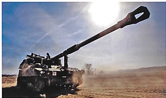
Panzerhaubitze KAWEST auf dem Wpl Biere.

Es war ein politischer Entscheid: Der Ständerat beschloss in der Frühlingssession 2015 im Rahmen der Weiterentwicklung der Armee drei, statt nur zwei mechanisierte Brigaden für das Heer aufzustellen. Ziel war die Stärkung des harten Kerns der Armee. Der Nationalrat folgte