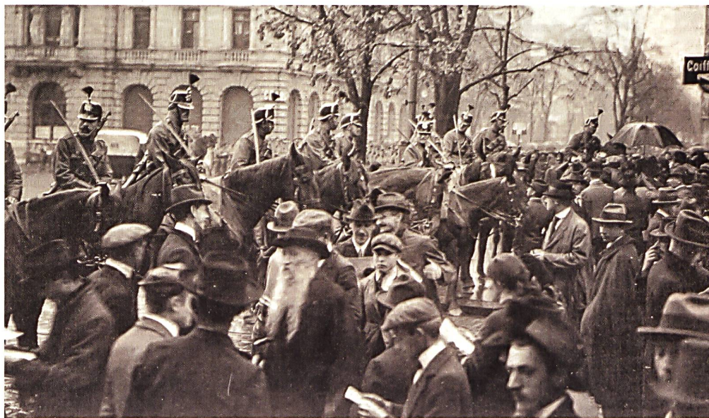
Kavallerie auf dem Zürcher Paradeplatz während des Landesstreiks.

Am 7.11. waren die Truppen (8000) für Zürich bereit und Sonderegger eingesetzt. Das Gleiche galt für Bern (8000) mit Eduard Wildbolz als Befehlshaber (gegen den Willen des Generals, der Fritz Gertsch wollte, dessen Truppen im Einsatz standen). Diese Bereitstellung von starken Ordnungsdiensttruppen löste einen Proteststreik des OAK auf Samstag, 9. 11. aus. Die Zürcher Arbeiterunion beschloss, diesen am Montag fortzuführen. Das zwang das OAK, den Generalstreik auszurufen, wenn es das Geschehen in den eigenen Händen behalten wollte.