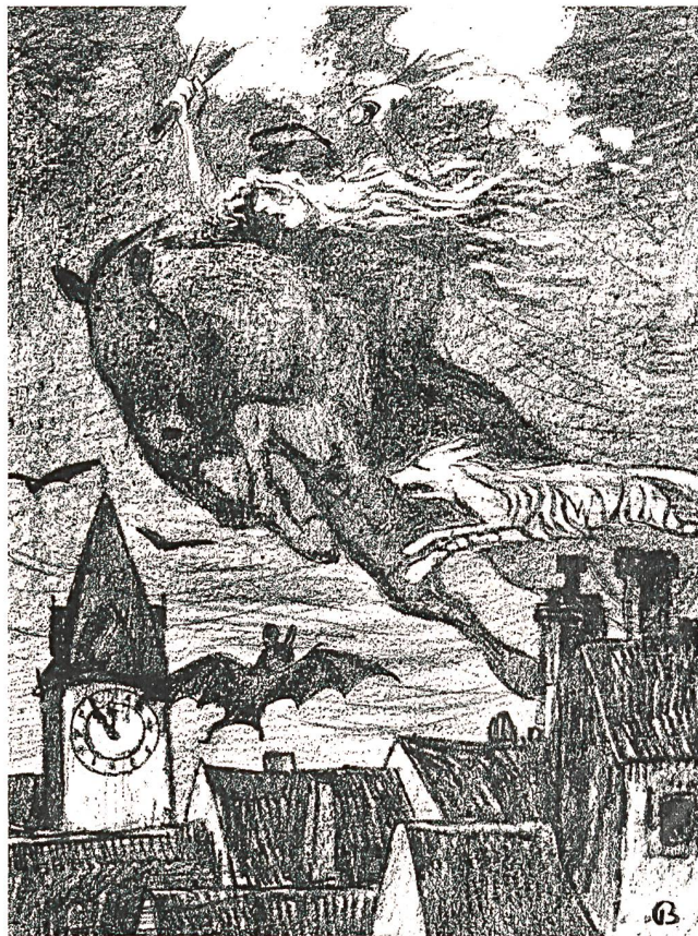
Kumm-pumm! Pumm! — Das Gespenst des Kommunismus geht um!

Völlig kontrovers in der historischen Aufarbeitung ist jedoch die Bewertung der Ideologisierung der sozial- und machtpolitischen Auseinandersetzung. Vereinfachend kann gesagt werden, dass die Arbeiterschaft der sozialdemokratischen- oder marxistisch revolutionären Ideologie zuneigte, während die bürgerlich-liberal-konservative Partei aus einer Position der demokratischen Tradition und weitgehend der ständisch-kapitalistischen Besitzstandswahrung argumentierte. In dieser brisanten Lage brauchte es nur noch radikalisierende Elemente, die den zündenden Funken ins prall gefüllte Pulverfass schleuderten. Dazu gehört beispielsweise der Versuch des Bundesrates Ende 1917, eine allgemeine Zivildienstvorlage durchzubringen. Diese Zivildienstpflicht sollte für alle nicht militärdienstpflichtigen Schweizerinnen und Schweizer von 14–60 Jahre eingeführt werden. Gegen diese «Militarisierung der Gesellschaft», Unterstellung der Bevölkerung unter die