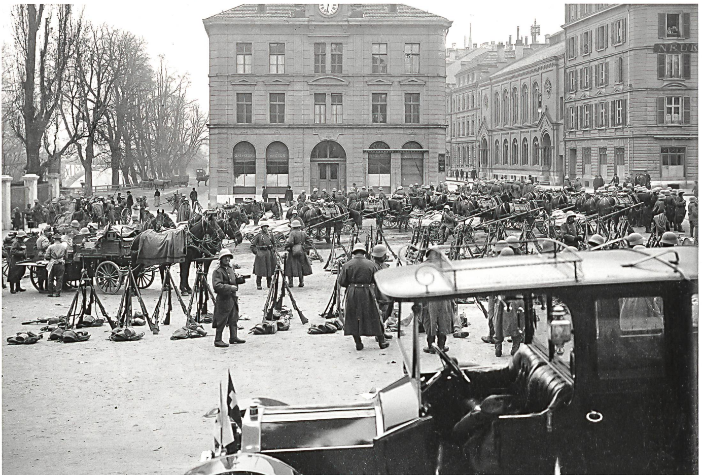
Truppen auf dem Zürcher Waisenhausplatz während des Landesstreiks.

Wir zeigen das – auch hier in gebotener Kürze – am Beispiel von Ulrich Wille. Diese Auswahl ist nicht unproblematisch, da der General nur einer unter ver-