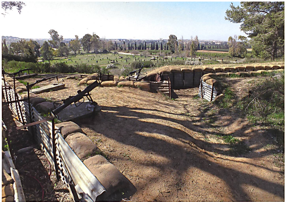
Nachbau der Gefechtsstellungen bei Yad Mordechai, ein israelisches Kibbutz nördlich des Gazastreifens. Hier haben die israelischen Verteidiger im Mai 1948 die ägyptischen Angreifer in einem erbitterten Kampf fünf Tage lang aufhalten können.

Am 15. Oktober brach Israel die Waffenruhe und eröffnete damit die dritte Runde des Krieges. Die israelischen Streitkräfte führten eine erfolgreiche Offensive gegen die ägyptischen Truppen in der Negev. An der nördlichen Front gelang es den israelischen Streitkräften Ende Oktober 1948, Galiläa zu erobern und gar in den Libanon vorzudringen.