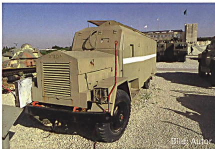
Gepanzertes Fahrzeug der israelischen Streitkräfte aus dem Unabhängigkeitskrieg.

Doch Israel gelang es, sich zu behaupten. Mit dem Sieg im ersten arabisch-israelischen Krieg konsolidierte Israel seine staatliche Existenz mit einer eindrucksvollen militärischen Performance. Zumal die territorialen Zugewinne die strategische Lage des jüdischen Staates erheblich verbesserten. Die Gebietsgewinne trugen