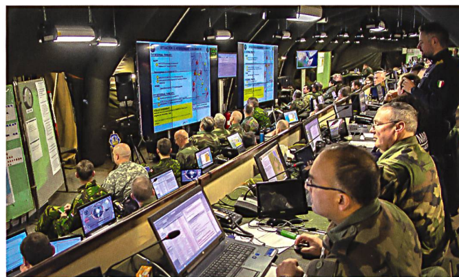
Bald auch ohne NATO: Hauptquartier des multinationalen «Corps de Réaction Rapide» in Lille.

neue Projekt auch Drittstaaten und somit Nicht-EU-Mitgliedern offen stehen soll. Frankreich will damit zukünftige (aussereuropäische) Krisen besser vorhersehen können, vor allem aber nicht mehr alleine in Konflikten wie in der Zentralafrikanischen Republik und in Mali intervenieren müssen. Der Zeitpunkt kurz vor dem Brexit schein gut gewählt zu sein: «Die zweitgrößte Armee der EU verlässt die Union, so dass dieses multilaterale Projekt Sinn macht», so ein Sprecher des französischen Verteidigungsministeriums.