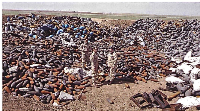
Irakische Minenräumer in Mosul.

Im ehemaligen Kernland des Islamischen Staates (IS) im nordöstlichen Syrien und dem angrenzenden Irak steht die in ihre Heimat zurückkehrende Bevölkerung vor einem neuen Problem. Wie Médecins sans Frontières (MSF) berichtet, erlitt die Mehrheit der derzeit in die lokalen Krankenhäuser eingelieferten Personen Verletzungen durch Landminen oder improvisierte Sprengladungen. Etwa die Hälfte der Betroffenen sind Kinder. «Landminen, Sprengfallen und andere improvisierte Sprengkörper werden auf Feldern, entlang von Strassen, auf den Dächern von Häusern und unter Treppen von ahnungslosen Familien gepflanzt», sagt ein Vertreter von MSF in Syrien. «Auch Haushaltsgegenstände wie Teekannen, Kissen, Kochtöpfe, Spielzeug, Klimageräte und Kühlschränke sollen explodieren, wenn Menschen nach Monaten oder Jahren der Vertreibung zum ersten Mal nach Hause zurückkehren». Allein aus Deir ez-Zor wurden infolge des Bürgerkrieges etwa 800 000 Menschen vertrieben, welche nun grösstenteils zu-