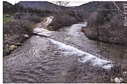
Grüne Grenze bei Evros.

bar wieder interessanter. Von den griechischen Inseln, wohin der gefährliche Weg übers Mittelmeer führt, schickt man