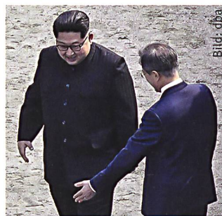
Nordkoreas Staatschef Kim überschreitet die Demarkationslinie. Der südkoreanische Präsident Moon heisst ihn willkommen.

Nord- und Südkorea wollen gemeinsam an einer vollständigen nuklearen Abrüstung der Halbinsel arbeiten. Das erklärten die beiden Staatschefs Kim Jong Un und Moon Jae In als