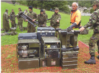
Angehörige der FU Ber Kp 104 bereiten die Telekommunikationsmittel der Armee für den Lufttransport vor, welche 2017 im Bondasca-Tal für die Alarmorganisation installiert wurden.

Organisatorisch hat sich die FU Br 41/SKS auf Stufe Bataillon primär im Fachbereich Richtstrahl verändert: Die Ristl Bat 19 und 20 wurden per Ende 2017 aufgelöst. Zudem wurde die EKF Abt 46 in die «Elo Abt 46» umbenannt. Die FU Ber Kp 104/204 wurden neu dem Kdo FU SKS direkt unterstellt, anstelle der bisherigen