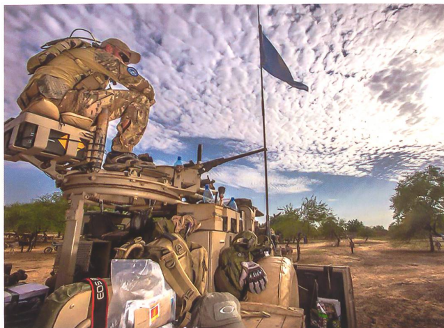
Holländische UNO-Sonderoperationskräfte in Mali.

Sie gilt als die gefährlichste UNO-Friedensmission. Die so genannte «Mission Multidimensionnelle Intégrée des Nations Unies pour la Stabilisation au Mali» (MINUSMA) geht in ihr sechstes Jahr. Ein kurzer Blick zurück zeigt, dass sich die Situation im Sahelland wenig verbessert hat. Die MINUSMA mit ihren etwas über 12000 Soldaten, knapp 1700 Polizisten und ihren 1200 Zivilbeamten versucht zwar ihr Bestes. Dennoch verloren in den letzten fünf Jahren 99 Soldaten das Leben und weitere 358 wurden bei Kampfhandlungen schwer verletzt (Stand März, 2018). Von den 59 mitwirkenden Nationen ziehen nun die Niederlande ihre Konsequenzen. «Wir werden unseren derzeitigen Beitrag zur UN-Mission bis zum 1. Mai 2019 einstellen», berichtete das holländische Verteidigungsministerium. Im Camp Castor in der Nähe der Stadt Gao im Osten Malis sind aktuell noch 250 niederländische Soldaten stationiert (zwecks «long-range»-Aufklärung, Nachrichtenauswertung