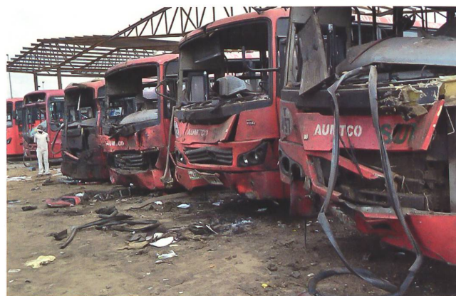
Selbstmordanschlag: Alltag mit Boko Haram.

der Bevölkerung auf der Flucht. Davon befinden sich etwa eine Million Personen in Gebieten, welche für Hilfe unzugänglich sind. Sicherheit, anhaltende Feindseligkeiten, Regenzeit und Bürokratie erschweren jegliche Notprogramme. Anfangs Mai waren zudem mehr als 215000 Flüchtlinge in den umliegenden Ländern Kamerun, Niger und Tschad registriert. Die effektive Zahl dürfte um ein Vielfaches höher liegen. Zwangsrückführungen aus Kamerun finden unter menschenunwürdigen Verhältnissen statt, so Experten des UN-Flüchtlingshilfswerks