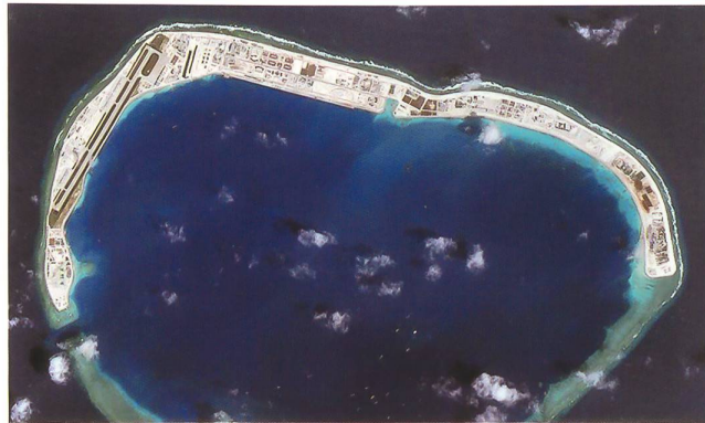
Chinesische Aufschüttung «Mischief Reef» im Jahr 2018; noch im 2016 war es unter Wasser bei Flut.

Das riesige Südchinesische Meer mit seinen vielen kleinen Inseln und Riffen dehnt sich rund 1500 Kilometer weit nach Süden aus. Anrainerstaaten sind neben China auch Vietnam, Malaysia, Brunei, Indonesien, Taiwan und die Philippinen. Allesamt erheben teils konkurrierende Ansprüche auf einzelne Inseln.