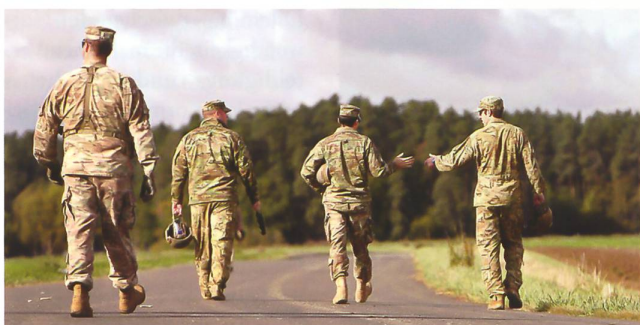
US-Soldaten in Deutschland.