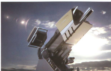
RUAG COBRA Mörsersystem

Das RUAG COBRA 120mm Mörsersystem ist ein Hightech-Produkt, das neue Massstäbe für indirekte Feuersysteme setzt. Ein elektrischer Antrieb und eine halbautomatische Ladevorrichtung sorgen für entscheidende Präzision und Schnelligkeit. RUAG COBRA kann einfach auf jedem Rad- oder Kettenfahrzeug montiert werden und ist so ausgelegt, dass die Nutzer das System schon nach kurzer Schulungsdauer versiert einsetzen können.