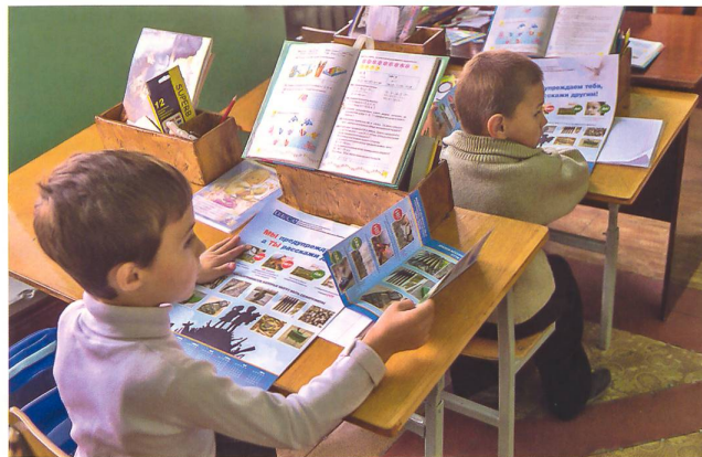
«Mine Awareness Training» in der Schule.

Bald fünf Jahre nach dem Euromaidan sind kriegerische Auseinandersetzungen in den Gebieten um Luhansk und Donezk alltäglich. Weiterhin bleiben Waffenstillstandsverletzungen und die wiederholte Beschiessung kritischer Wasser-, Sanitär-, Elektro- und Heizungsinfrastrukturen die grösste Bedrohung für knapp 3,4 Millionen Menschen. Psychosoziale (Stress-)Reaktionen führen deshalb die Rangliste der Probleme der Bevölkerung in der Region an. Von knapp 3,5 Millionen hilfsbedürftigen Menschen sind 500 000 Minderjährige vom andauernden Konflikt in der Ostukraine direkt betroffen. Diese, als Teil der besonders vulnerablen Be-