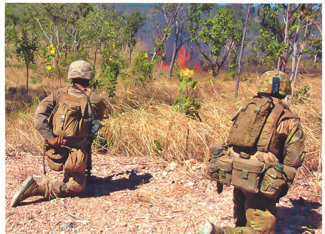
US-Marines bei einer Übung in Australien.

Die USA sehen Chinas Einfluss im Pazifik als ernsthafte Bedrohung für ihr globales Gewicht an. Die Alliierten Australien und Neuseeland unternahmen Schritte, um dieser Bedrohung entgegenzuwirken, wobei Australien kürzlich Unterwasser-Telekommunikationskabel von den Salomonen nach Austra-