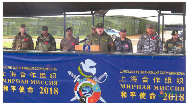
Eröffnungsansprache zur SOZ-Übung.

zen Ausbildungsphase mussten in der letzten Augustwoche die beinahe 3000 Teilnehmer des Manövers mit dem Decknamen «Friedensoperation 2018» in realen Szenarien sowie Stabsrahmenübungen ihre Fähigkeiten prüfen lassen. Die Übung gipfelte darin, dass eine von Terroristen eroberte Stadt wiedereingenommen werden musste, was «im scharfen Schuss» geschah. Die Manöverkritik fiel durchwegs positiv aus. Zuerst erkundeten Drohnen das Angriffsziel, Luftnahunterstützung führte