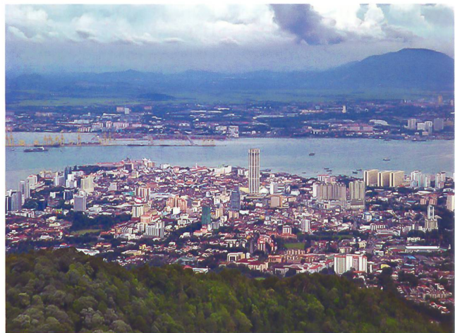
Malaysia am Nadelöhr der Strasse von Malakla.

Jetzt unterrichtete Malaysias Premierminister Mahathir