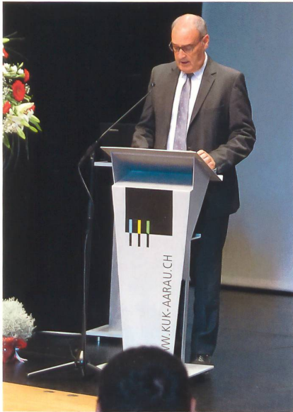
Für VBS-Vorsteher Guy Parmelin umgehen momentan zu viele junge Leute den Militärdienst.