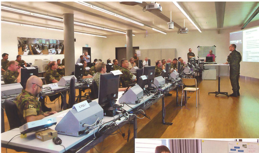
Die Lageverfolgung ist im Einsatz der Schlüssel zum Erfolg.

Leistungserbringung zusätzlich und führte dazu, dass in Absprache mit dem Kommando Operationen die Aufträge stark priorisiert werden mussten. Als dritte Herausforderung musste zusammen mit der Landesversorgung und der zivilen Wirtschaft das zivile, nationale Potenzial für die Auftragsbefreiung der Armee analysiert und erschlossen werden, ohne dass die Zivilbevölkerung übermässig darunter leiden durfte. Das Recht der Armee zur Requisition im Aktivdienst kam zur Anwendung.