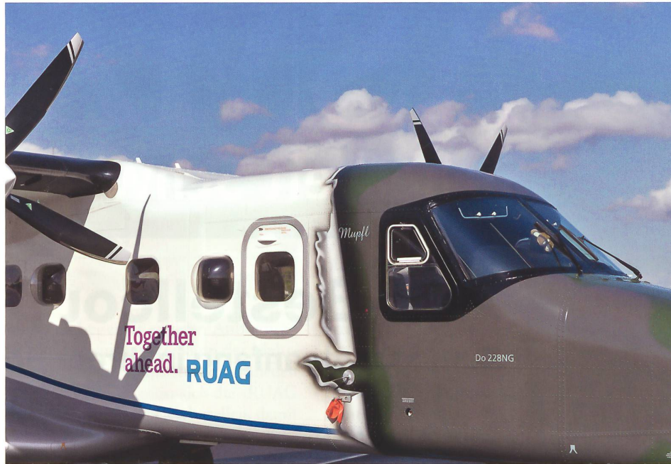
Dornier 228 an der Luftfahrzeugausstellung ILA.

Die angedachte Entflechtung sieht vor, eine «RUAG Schweiz» und eine «RUAG International» (beides Arbeitstitel) unter dem Dach einer neuen Beteiligungsgesellschaft zu bilden. In der «RUAG Schweiz» sollen alle Leistungen für die Schweizer Armee zusammengefasst werden (in erster Linie für Wartung, Reparatur und Überholung = MRO). Dies entspräche primär den beiden bisherigen Divisionen RUAG Aviation und RUAG Defence. Zählt man deren Umsatzvolumen zusammen, so ergäbe sich ein Betrag von rund 900 Mio. CHF. Die RUAG beziffert die Leistungen der Materialkompetenzzentren für die Schweizer Armee und damit für die neue «RUAG Schweiz» jedoch auf bloss rund 400 Mio. CHF. Dies bedingt folglich keine «artreinen» Umorganisationen einzelner Divisionen, sondern stets neue Schnittstellen und Verschiebungen. Der deutlich überwiegende Rest der heutigen RUAG, namentlich der internationale und der «nicht sicherheitsrelevante Bereich» (unter anderem Cyber!), würden in