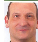
Brigadier Marco Schmidlin Chef Armeepanee Armeestab/Armeepanee 3003 Bern

Die Beschaffungen werden in Form von Rüstungsvorhaben jährlich im Rahmen der Armeebotschaft zuhanden des Parlaments vorgeschlagen. Die Armeebotschaft umfasst nebst dem Rüstungsprogramm (RP) die Bundesbeschlüsse zum Immobilienprogramm VBS, Rahmenkredite für Armeematerial (AEB, AMB, PEB) und die Ausserdienststellung von nicht mehr benötigten Waffensystemen.