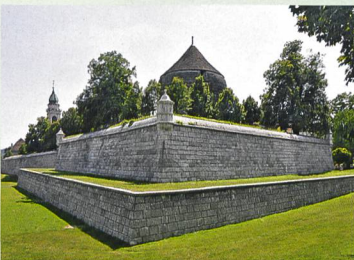
34 Schanzen in Solothurn