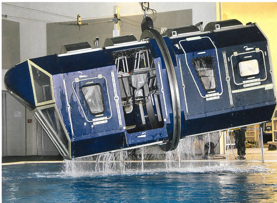
Objekt der Begierde: Der METS kopfüber im Hallenbad der Marineoperationsschule.

Wieder ist es der gelbe Strick, befestigt an der Schwimmbadbeckenleiter, die bis auf eine Tiefe von 5,28 Meter reicht. Im Gegensatz zur ersten Übung allerdings, haben die Tauchinstruktoren der Deutschen Bundeswehr, Ohlendorf und seine Kollegen, nun das Seil nicht mehr auf rund zwei, sondern am Grund auf fünf-einhalb Metern angebracht. Das Szenario: Im Fliegeranzug und Überlebensweste mit angehaltener Luft entlang der Leiter abtauchen, unten angekommen hält einen Ohlendorf fest, was den unmittelbaren Griff nach dem Mundstück der STASS erfordert. Anschliessend zieht man sich entlang des Stricks am Schwimmbadboden in 5,28 Metern Tiefe zur gegen-