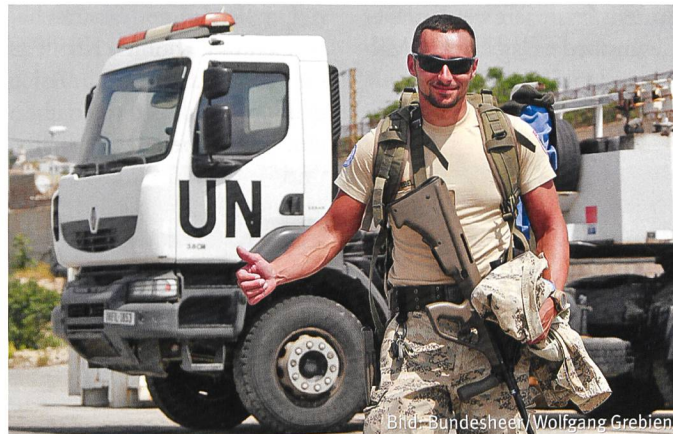
Bleibt: ÖBH-Soldat der Multi Role Logistic Unit im Libanon.

Konkret können laut Beschluss weiterhin bis zu 600 Soldaten in den Kosovo (Bestand aktuell 430), 400 nach Bosnien Herzegowina (Be-