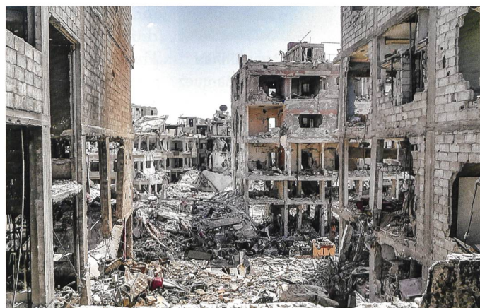
Yarmouk nach der Rückeroberung.

das UNRWA, welches durch einen UNO-Sicherheitsratsbeschluss 1949 gegründet wurde und insgesamt für mehr als fünf Millionen vertriebene Palästinenser zuständig ist, eine erste Schadensbewertung in den Flüchtlingslagern Yarmouk bei Damaskus sowie Dera'a im Süden Syriens im vom bald von acht Jahren Bürgerkrieg gezeichneten Land durch.