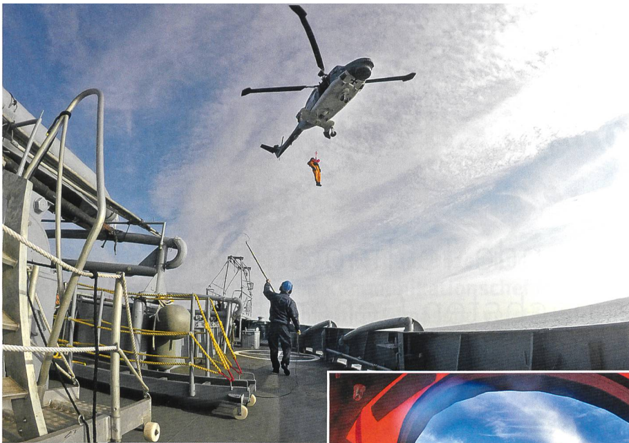
Gerettet und geschafft: der Helikopter der Bundeswehr setzt mich auf der Wangerooge ab.

rasch gefährlich werden. Direkt daneben befindet sich das Fahrwasser der Elbe.