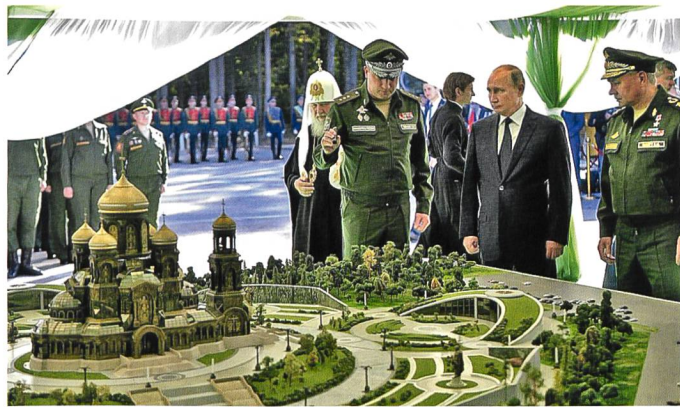
Die politischen, militärischen und geistlichen Spitzen vor dem Modell.