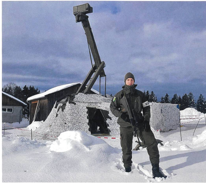
Bundesheer im Einsatz fürs WEF 2019.

Der Milizbeauftragte des Österreichischen Bundesheers, Generalmajor Erwin Hameseder, zeichnet ein schlechtes Bild vom Zustand der Streitkräfte. Er erwartet, dass die Ausrüstung der Miliz oberste Priorität hat. Sie sei, so der General, nämlich aktuell gar nicht einsatzfähig. Es fehlt an persönlicher Ausrüstung und genügend Fahrzeugen. Hameseder betont: «Der Milizsoldat ist ein Einsatzsoldat. Wenn dieser mangels Geldes seine Bestimmung nicht erfüllen kann, erübrigt sich die Sinn- und Zweckfrage». Insgesamt geht es dabei um 29000 Milizangehörige und 200 Millionen Euro. Mit diesem Geld könnten wenigstens ein Drittel dieser Soldaten vernünftig ausgerüstet, aber vor allem bewegt werden, meint Hameseder und fügt an: «Die Miliz ist de facto nicht mobil». Auch wenn die Regierung und kürzlich bei seiner Neujahrsansprache Präsident Van der Bellen nicht müde werden, den Investitionsbedarf zu unterstreichen und Budgeterhöhungen ankündigen, könne man der im Regierungsprogramm festgehaltenen «sofor-