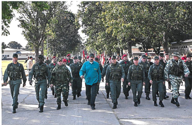
Maduro führt demonstrativ das Militär an.

Brenzlicher ist die Lage auf den Strassen und in der Armee. Auch wenn sich die Politik zurückhält, geht die Bevölkerung auf die Strasse. Demonstrationen und Festnahmen gehören zur Tagesordnung. Bis Ende Januar sprachen verlässliche Quellen von etwa 800 Festnahmen durch die Maduro-treue Polizei. Pikant dabei: Erstmals war es auch in den bis dahin regimetreuen Armenvierteln zu