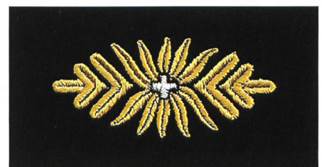
Versuchstyp einer Blattrosette für Kragenspiegel Gst Of, Ordonnanz 1949.

Historischer Reiseführer 200 Jahre ZS/HKA: Details unter: www.armee.ch/200-jahre-zs . Die Kapitel können als PDF heruntergeladen oder beim Kdo HKA in Printversion bezogen werden.