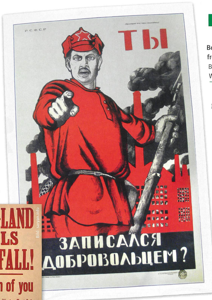
Bolschewiki: Aufruf zur freiwilligen Meldung, 1920. Bild: Kampf gegen die Weisse Armee

Kluge Strategen in allen Zeiten wussten über die Möglichkeiten dieser ursprünglich gruppenschützenden Mechanismen Bescheid. Ganze Gesellschaften lassen sich mit deren Hilfe steuern, wobei es sich in erster Linie um ein langfristig wirkendes strategisches Instrument handelt, der tak-