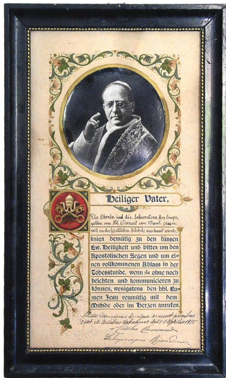
Macht der Moral: Ablasshandel im Mittelalter.

Und somit gilt auch nach wie vor: Moral kann unterschiedliche Funktionen annehmen. Sie kann strategisches Handeln begrenzen und damit als Kontrollinstanz der Gesellschaft dienen. Sie kann aber auch als subtiles und mächtiges Mittel von Strategen missbraucht werden, um ganze Massen zu lenken. An dieser Stelle wird übrigens deutlich: derjenige, der die Moral bestimmt, beherrscht die Bevölkerung und ist somit auch der tatsächlich Herrschende. Was Moral jedoch letztendlich nicht ist: ein Ziel – auch wenn der Gedanke daran ein ergreifender ist. ■