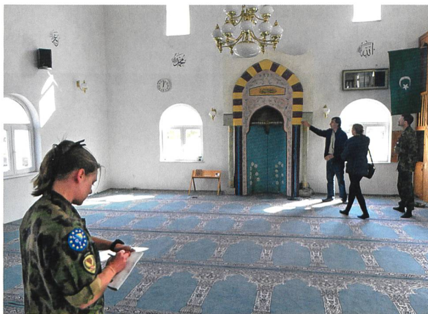
Moschee im multi-ethnischen Dorf Domanovici.

starkem Einfluss von Serbien und Russland, währenddem die kroatische Bevölkerung in reinen kroatischen Teilen der Herzegowina mit den Wahlergebnissen 2018 unzufrieden ist und sich diskriminiert fühlt. Zwei Erlebnisse sollen illustrieren, welchen Vorteil der Einsatz von weiblichen AdLOT bietet.