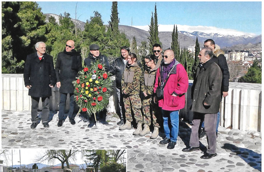
Das LOT Mostar beobachtet eine Partisanenversammlung.

Eines der wohl brisantesten Sicherheitsrisiken sind zur Zeit nationalistisch-radikale Tendenzen, die jederzeit zu Protesten oder gar Gewalt ausarten könnten; instrumentalisiert und angefeuert von der Politik. Somit ist eines der Missionsziele, Informationen innerhalb der Bevölkerung zu diesen Strömungen zu gewinnen. Dazu gehört, dass wir über Feierlichkeiten der verschiedenen Ethnien Kenntnis haben und in Erfahrung bringen, ob solche politisch missbraucht werden, beleidigend gegenüber einer anderen Ethnie wirken oder gar ausarten können. So steht beispielsweise die serbische Bevölkerung in der RS unter