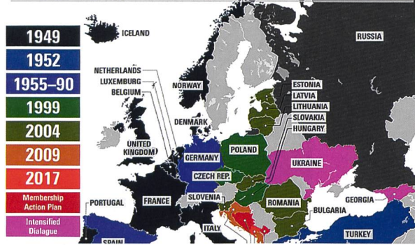
NATO-Osterweiterung bis 2018.

Auslöser bezeichnen müssen, und nicht Russland, welches sich seit dem Ende des Kalten Krieges in der Defensive befindet.