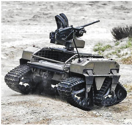
Heute Utopie, bald Realität: Autonome Roboterwaffensysteme.

Der künftige Landkrieg wird hauptsächlich in Städten geführt und wird tödlicher sein, als alle Kriege seit dem Zweiten Weltkrieg. Selbst die US-Bodentruppen können nicht mehr – bislang eine Selbstverständlichkeit – vor ihrem Angriff mit der Zerschlagung des Gegners durch die Luftwaffe rechnen. Oft muss das Feindgebiet besetzt und die dortige Luftabwehr ausgeschaltet werden, bevor die Luftwaffe eingreifen kann.