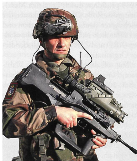
Französische Streitkräfte: Le «soldat augmenté».

teidigungskompetenz», das «savoir-faire», aber «im kleinstmöglichen Umfang» beschränkt. Auf die «Fähigkeit» zur «Verteidigung» der Schweiz wurde ausdrücklich verzichtet. Diese deutlichen Worte wurden in der folgenden Erläuternden Erklärung ... vom 03.09.2014 durch positive ersetzt (die Armee «schützt»), aber die vom Parlament 2014 bewilligte