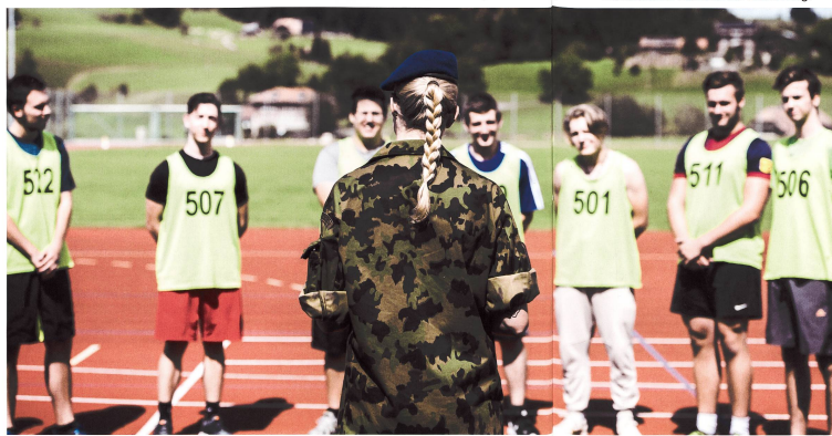
Instruktionen während der Aushebung.