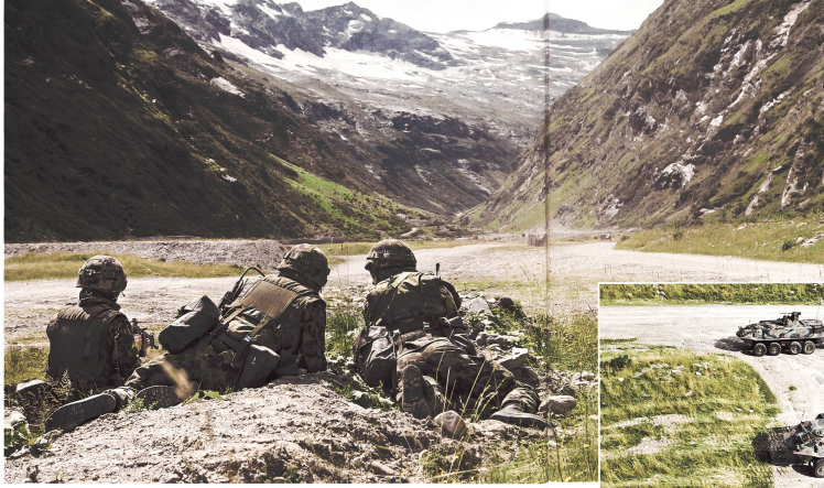
Infanteristen während eines Gefechtssexerzierens.

war es, rasch auf unterschiedliche Lageentwicklungen reagieren zu können. So musste das Kader etwa darauf gefasst sein, Grundentschlüsse laufend anzupassen und Eventualplanungen durchzuführen.