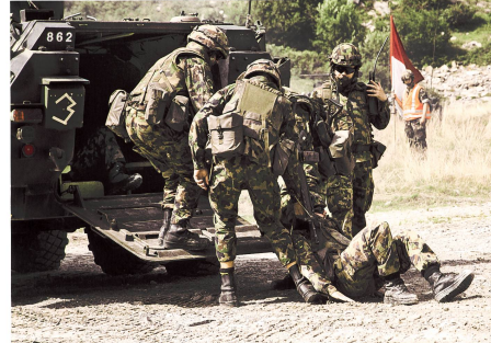
Kameradenhilfe während eines Gefechtschiessens.

merkte diesbezüglich: «Meine Elemente erkunden die definierten Marschachsen. Die Späher überwachen den Einsatzraum und geben Meldungen schnell und in hoher Qualität an die Führung weiter.»