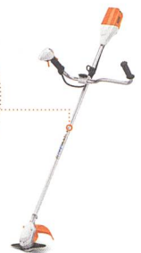
AKKU-MOTORSENSE FSA 90