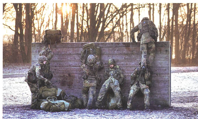
Noch nicht alle Hindernisse überwunden.

die Frage danach, wie es sein kann, dass die deutsche Industrie für den Export innert zwei Jahren 50 Panzer «nigelnageln» fabriziert, die eigene Armee jedoch sieben Jahre auf die Erneuerung von hundert alten Leoparden warten muss. Die Bundeswehr sei «leider noch sehr weit davon entfernt, 100 Prozent der Waffen, Munition und der persönlichen Ausrüstung zu haben. So wie es eigentlich nötig wäre», so Bartels. Das sei aber auch nicht erstaunlich, denn jede neue Beschaffung benötigt ein Jahrzehnt. So genannte «funktionale Fähigkeitsanforderungen» führen zu «neu erfinden,