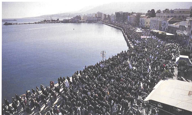
Proteste in Mytilin, Griechenland.

Auch das Jahr 2019 brachte keine Lösung der Flüchtlingsfrage. Insgesamt kamen laut der International Organisation for Migration (IOM) 123 920 registrierte Migranten an den EU-Aussengrenzen an. Mehr als 100 000 auf dem Seeweg über das Mittelmeer. Weniger als in den vergangenen Jahren. Diverse Staaten hinderten zivile Rettungsschiffe am Anlegen, die EU versuchte ihre Aussengrenzen abzuriegeln. Zahlreiche Gipfeltreffen hätten ganzheitliche Lösungen präsentieren sollen. Griechenland und Bulgarien zählen zu den Ländern mit den meisten Neuanrücklingen auf dem Landweg. Beide konnten aber die unregistrierte Migration innert Jahresfrist um 90% senken. Kroatien kämpft mit den meisten illegalen Grenzübertritten. Geschätzte 200 000 Flüchtlinge verteilen sich über diverse Balkanländer ausserhalb der EU-Grenzen. In Glinica, im Nordwesten Bosnien-Herzegowinas, werden täglich Flüchtlinge von kroatischen Grenzpolizisten zurückgeprügelt.