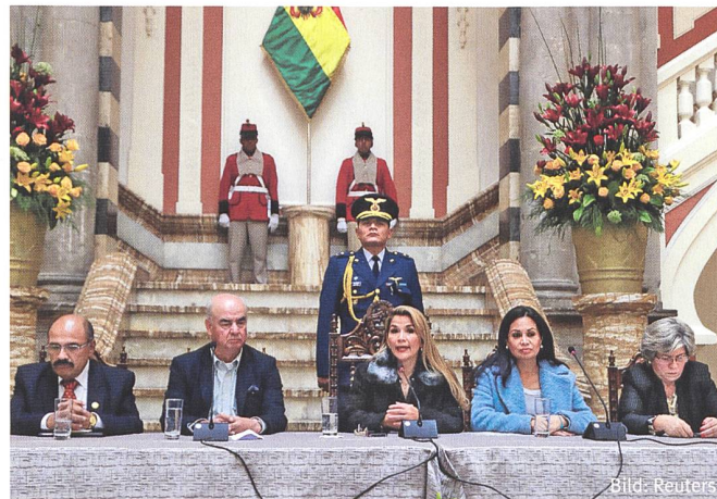
Militär im Rücken: Boliviens Übergangspräsidentin Jeanine Añez.

Laut dem aktuellen Latino-barometro 2018, einer in 18 lateinamerikanischen Ländern durchgeführten Studie, vertrauten nur 13 Prozent der Bevölkerung politischen Parteien und nur 22 Prozent der eigenen Regierung – hingegen 63 Prozent der katholischen Kirche, 44 Prozent dem Militär und 35 Prozent der Polizei. Nur in Venezuela liege die