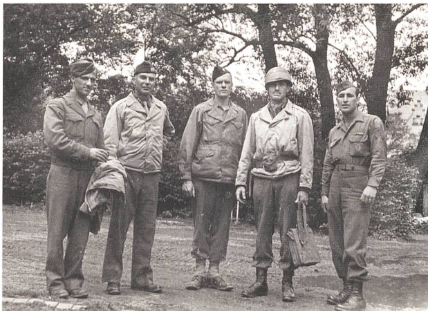
The Monuments Men.

In diesem Artikel wird versucht, eine Brücke zu schlagen und die Anregung in den Raum zu stellen, den zivilen Ersatzdienst für Gewissensgründe beizubehalten, gemäss Art. 59 BV der Bundesverfassung. Für andere «Ausstiegsgründe» ist