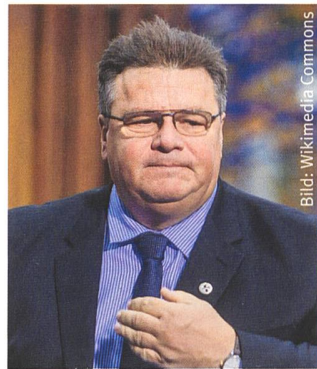
Beunruhigt: Linas Linkevičius.

heit speziell im Baltikum, das nach der Befreiung von den Nazis jahrzehntelang unter dem Eisernen Vorhang litt. In diesem Zusammenhang nannte Linkevičius den Vorschlag