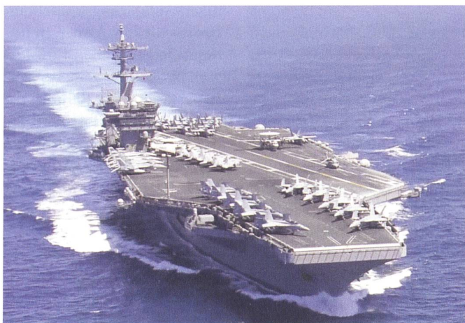
USS Theodore Roosevelt.

der Angriffe in den letzten vier Jahren. Allein 2019 gab es mehr als 4000 Terrortote. Bedrohlich wird die Lage nun auch für die weiter südlich gelegenen Länder. Die Elfenbeinküste, Togo, Benin und auch Ghana (wo die USA eine Logistikkbasis betreiben) werden zunehmend von extremistischer Gewalt betroffen. Das Amerikanische Afrika-Kommando (AFRICOM) teilte deshalb Ende März dem Generalinspektor des Verteidigungsministeriums mit, dass es sich ab sofort nur noch auf die aktive Eingrenzung der allgemeinen Bedrohung fokussiert und seine Strategie der langfristigen Schwächung der Islamisten aufgegeben hat. Auch wenn die USA über 320 Millionen US-Dollar in den letzten beiden Jahren zu Gunsten der militärischen Ausbildung der G5-Truppen aus Burkina Faso, Mali, Niger, dem Tschad und Mauretanien ausgab, so kann diese 5000 Mann starke Einheit wenig gegen den Vormarsch der Islamisten ausrichten. Die strukturellen Probleme werden, so sind sich Experten einig, langfristig auch durch verstärkte Entwicklungs-