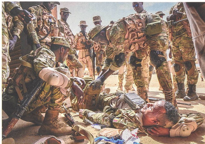
Taktische Wundversorgung im Training, Soldaten aus dem Tschad und Senegal.

hilfe nicht gelöst werden können. Derzeit könne man nur noch dem Beispiel des AFRICOM folgen und die Aggressoren aktiv eindämmen. Dies versucht Frankreich, welches weitere 600 Soldaten in die Region entsendete und damit seine bereits vorhandenen 5100 Kämpfer verstärkt. Bis Ende Sommer sollen weitere 400 Spezialkräfte aus verschiedenen Euro-Ländern im Rahmen von EU-Ausbildungsmissionen eintreffen und die lokalen Streitkräfte für den Kampf gegen Al Qaida, den IS sowie Boko Haram fit machen. Zusammen mit den etwas über 5000 US-Soldaten eine stattliche Anzahl, aber viel zu wenig