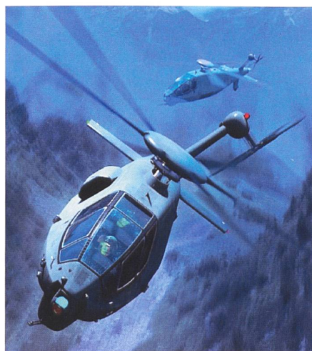
Boeing-Kampfheli, Entwurfsbild Bild: Boeing

Äusserlich wirkt er dadurch weniger futuristisch als andere FARA-Kandidaten, aber