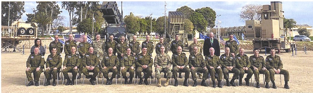
Übungsleitung vor dem IDF Luftabwehr-Arsenal.

den BODLUV-Systemen Arrow 2 und Arrow 3. Zusammen mit einem upgegradeten Iron Dome und der David-Sling standen die fortschrittlichsten Systeme bereit, welche die IDF derzeit zu bieten hat. Zudem kam das «Ballistic Imaging Management Center» zusammen mit dem Homefront Command zum Einsatz. Ersteres unterstützt mittels computerbasierter Bildverarbeitung die forensische Identifizierung von diversen gegnerischen Waffensystemen. Eine gleichzeitig stattfindende Übung namens «Eagle Genesis» wurde aufgrund des Coronavirus abgesagt, laut US-Sprechern aus Vorsicht, da mehrheitlich Truppen aus Italien nach Israel rotiert wären.