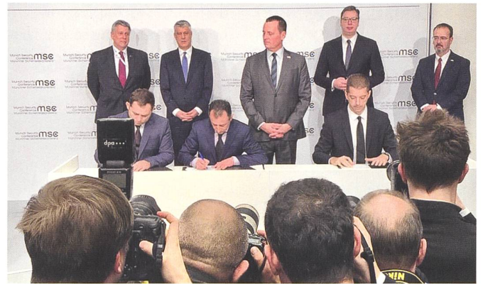
Grenell (Mitte) flankiert von Thaçi, (l.) und Vučić (r.) bei der Unterzeichnung in München.

Feuer zu giessen. Letztmals unter dem Regierungschef Ramush Haradinaj, welcher noch Ende November 2018 100% Zollzuschläge auf sämtliche aus Serbien importierten Produkte erheben liess. Der serbische Präsident Aleksandar Vučić vermeldete deshalb per Regierungserklärung, dass die Transportabkommen äusserst wichtig seien, denn sie regeln den Verkehr von Waren, Kapital und Dienstleistungen. Aber besonders erlauben Sie es der Bevölkerung, sich freier zu bewegen. Die beiden Staatsoberhäupter haben deshalb Mitte Februar anlässlich der Münchner Sicherheitskonferenz und im Beisein des ehemaligen Sondergesandten des US Präsidenten, Richard Grenell, die notwendigen Verträge unterzeichnet. Als Wermutstropfen bleibt, dass die neue, seit Anfang Februar im Amt stehende kosovarische Regierung noch am gleichen Tag die Gültigkeit der Abkommen in Frage stellte. Diese seien nämlich vom ehemaligen