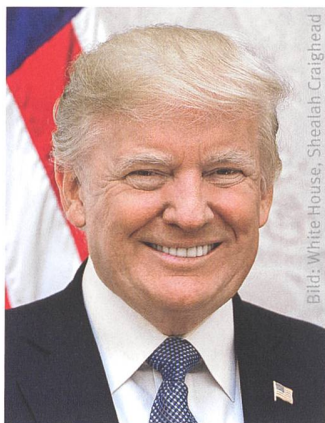
Präsident Donald Trump