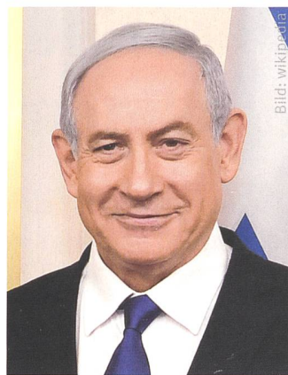
Ministerpräsident Benjamin Netanjahu

drei Optionen geben: Entweder ziehen sie in den zukünftigen Palästinenserstaat, werden Staatsbürger der Länder, in denen sie derzeit leben oder sie lassen sich in einem anderen Land nieder;