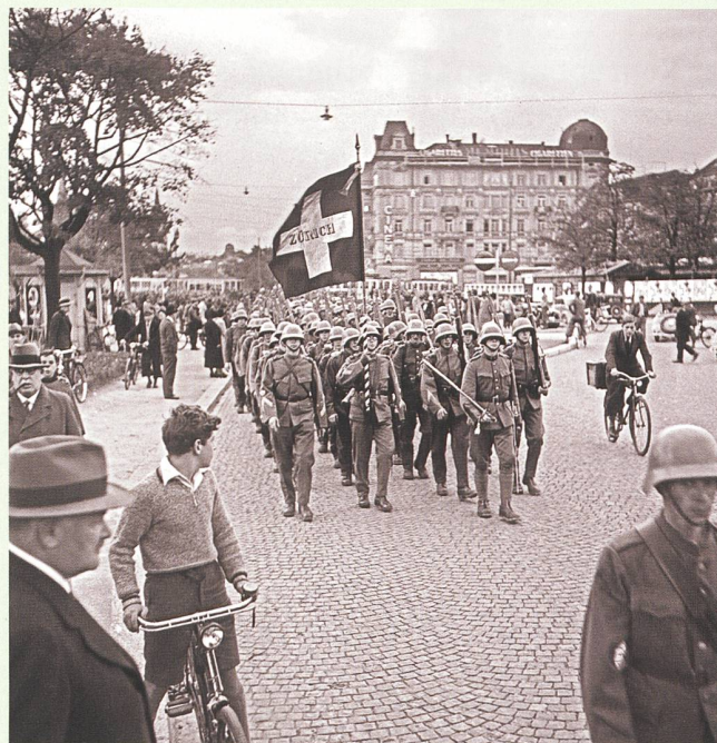
Ein Zürcher Füsilierbataillon beim Abmarsch in den WK über den Bellevueplatz 1938.